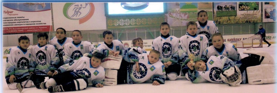
Команда 2004 г.р. "Биектау" 2014г.